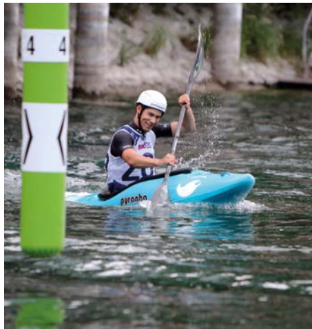
Am Nachwuchscup Zürich 2024 wird es erneut ein Kayak-Cross-Rennen geben.

Der Nachwuchscup Zürich 2023 war trotz des herausfordernden und zeitlich engen Programms ein riesiger Erfolg. Auch dieses Jahr braucht es wieder viele helfende Hände.