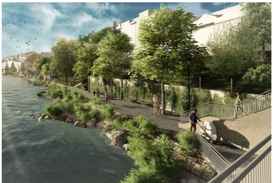
Unterhalb des Dammstegs soll das rechte Limmatufer mit Sichelbuhnen usw. renaturiert werden. (Visualisierung: Stadt Zürich)