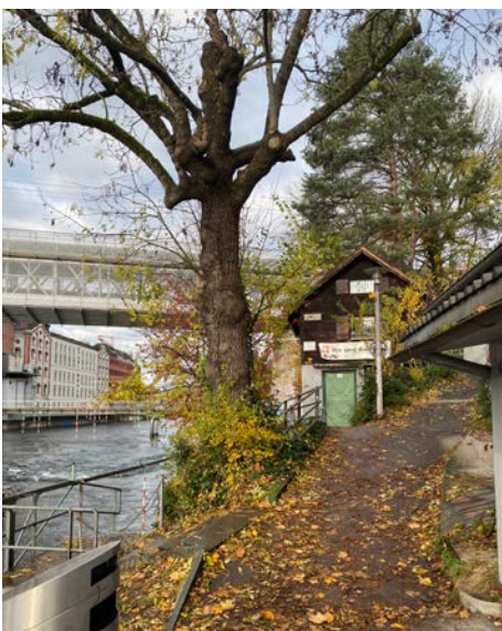
Diese Esche soll gefällt werden, damit der Kloster-Fahr-Weg zwischen Bootshaus 2 (im Hintergrund) und Bootshaus 5 (rechts) weniger Steigung und Gefälle aufweist.

Unterhalb des Dammstegs sind in der Limmat zwecks Renaturierung Sichelbuhnen, Raubbäume (verankerte tote Bäume) und Wurzelstöcke geplant. Im Rahmen des gesetzlich vorgeschriebenen Mitwirkungsverfahrens hat der WWZ verlangt, dass diese Flusseinbauten so ausgestaltet werden, dass keine Gefahr besteht, als Schwimmer oder mit einem Boot (auch Gummiboot) hängenzubleiben und unter Wasser gedrückt zu werden.