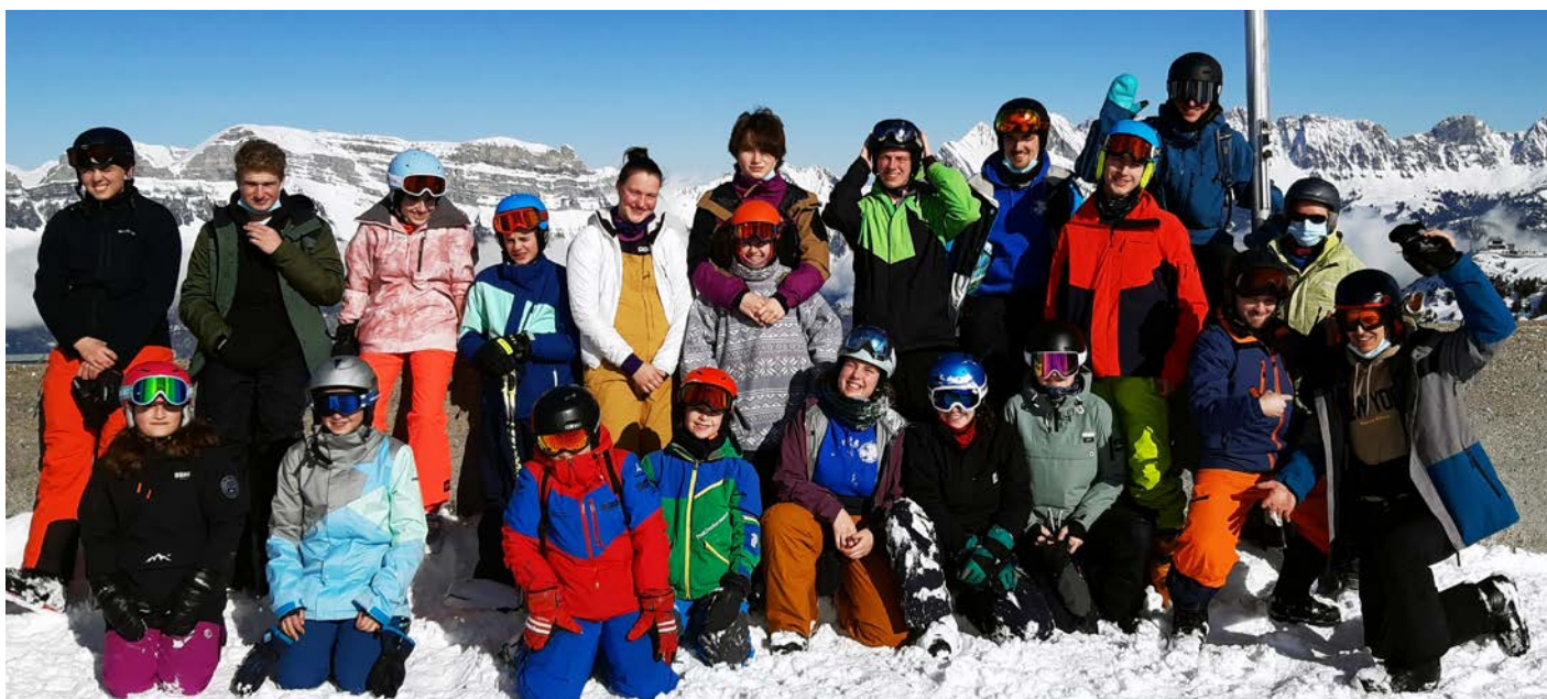
Sonne und glückliche Gesichter am WVZ-Schneesporttag in Flumserberg.

Am 5. Februar 2022 trafen sich 21 WVZ-ler in Flumserberg zum Skifahren und Snowboarden. Diesen Jugendanlass führen wir nun bereits seit mehreren Jahren durch. Nachdem wir ihn letztes Jahr leider hatten absagen müssen, freuten wir uns nun umso mehr, ihn dieses Jahr wieder durchführen zu können. Er ist nicht nur bei den Jugendlichen sehr beliebt, sondern auch bei den Leitenden. Dies widerspiegelt sich auch in den Anmeldungen, denn von den 21 Personen waren 9 Leiterinnen und Leiter.