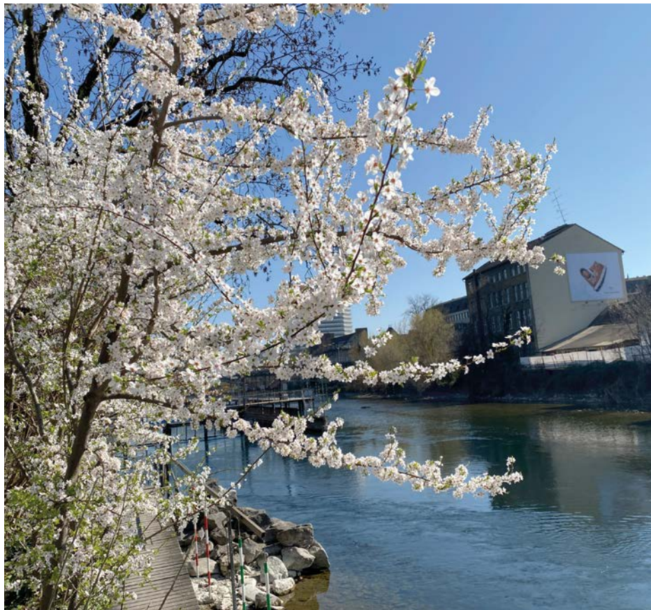
Mit sehr wenig Wasser, aber wunderschön blühenden Bäumen: So zeigte sich der Untere Letten an einem sonnigen Märztag. Dieser liess nicht erahnen, dass es Anfang April nochmals einen Wintereinbruch mit Schnee bis in die Niederungen geben würde.