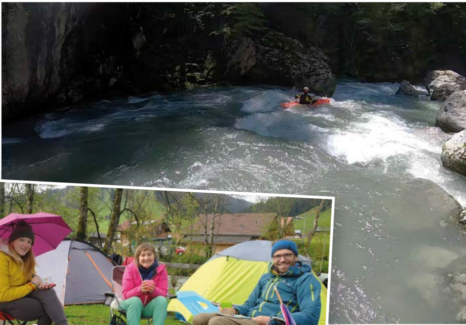
Impressionen vom Pfingstwochenende an Simme und Saane.

Das diesjährige Pfingstwochenende bescherte den Paddlern wechselndes Wetter und eher hohe Wasserstände. Der guten Stimmung tat dies aber keinen Abbruch.