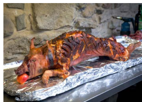
Das Spanferkel ist ein wichtiges, aber nicht das einzige Element des Span-Paddel-Fests vom 21. August 2021. Und es gibt auch Leckeres für Vegis.

Am Samstag, 21. August 2021 wird im Letten das Span-Paddel-Fest stattfinden, zu dem alle WVZ-Mitglieder mit Familie herzlich eingeladen sind. Während wir uns ab dem Mittag beim Spieleplausch vergnügen oder gemütlich am Grillplatz beisammensitzen, wird sich über dem Feuer das Spanferkel drehen. Abends essen wir es dann gemeinsam.