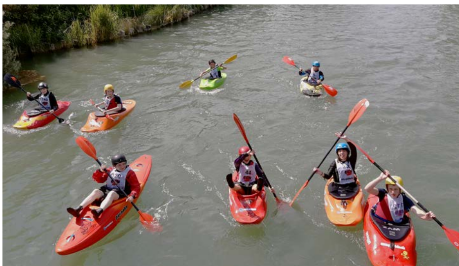
Das diesjährige Sommer-«Lager» fand tageweise statt. Hier einige Teilnehmerinnen und Teilnehmer beim Paddeln in Hüningen.

Auch dieses Jahr haben der WVZ und der Kanu-Club Zürcher Oberland (KCZO) zusammen wieder ein Jugendlager organisiert, wenn auch in heimischen Gefilden und ohne auswärtiges Übernachten. Einige Teilnehmer schildern ihre Erlebnisse.