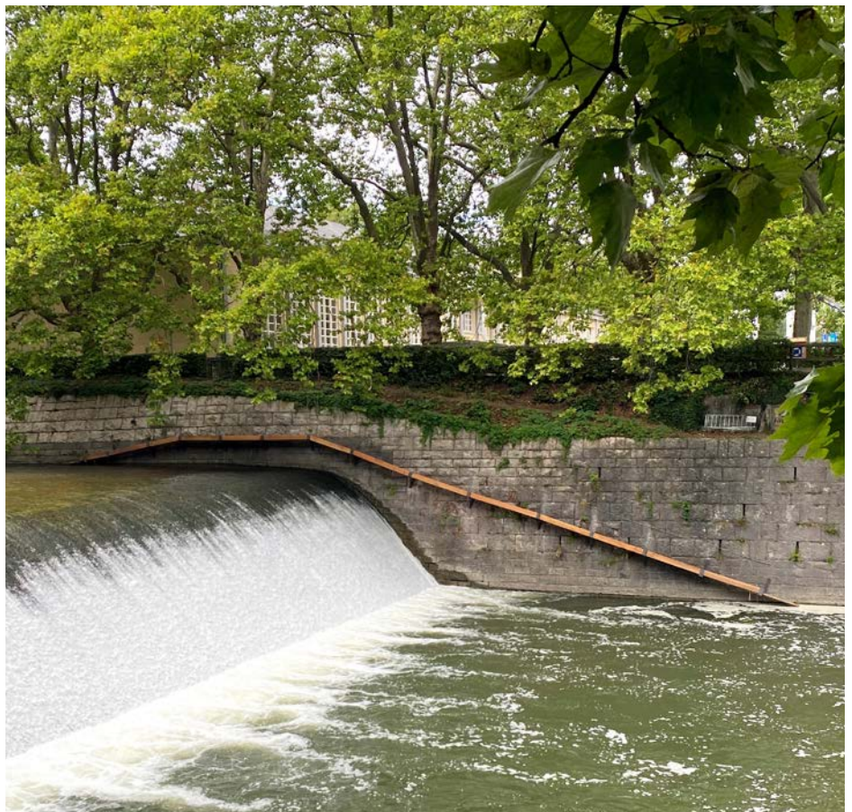
Der an der Ufermauer befestigte Steg beim Sihlhölzli ermöglicht es Bibern, das hohe Wehr zu passieren.