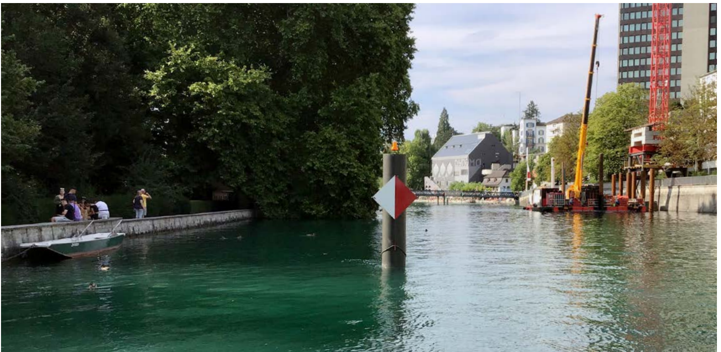
Wegen eines Bauprovisoriums hat es Stahlseile in der Limmat. In der Regel besteht linksufrig eine Durchfahrtsmöglichkeit.

muss vorgängig bei der Wasserschutzpolizei (Tel. 044 411 84 11) die Befahrbarkeit abgeklärt werden.