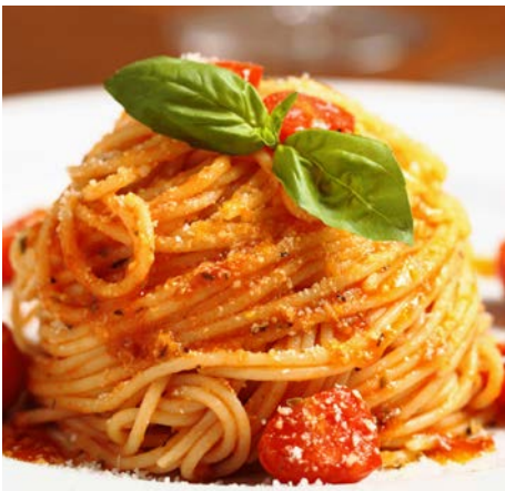
Ein Spaghettiplausch erleichtert Neupaddlern den Anschluss an den WVZ.

Am Donnerstag, 12. November 2020 findet um 19 Uhr im Bootshaus Letten für alle Kursabsolventen und Neumitglieder ein Spaghettessen statt. Sie erfahren dort, wie es mit dem Kajakfahren weitergeht, und bekommen alles Wissenswerte über den Wasserfahrverein Zürich zu hören. Zudem können sie sich darüber informieren, was nächstes Jahr läuft, und in gemütlicher Runde alte Bekanntschaften vertiefen und neue knüpfen.