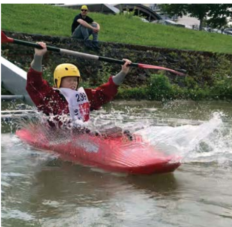
Viel Spass beim Rutschen ins Wasser.

Es ist Samstag, 9. Juni 2018, 9 Uhr. Die Kinder und die Leiter treffen langsam im Letten ein: Die Jugendgruppe des WVZ fährt nach Hüningen bei Basel – ein Event, das man nicht verschlafen möchte. Der Vereinsbus ist randvoll mit Material, jeder Sitzplatz ist belegt. Zwei zusätzliche Autos stehen bereit, um die Horde von dreizehn Jugendlichen mitzunehmen. Endlich am Kanal in Hüningen ist die Vorfriede riesig. Nach zweimal zwei Stunden Kehrwasserfahren, Surfen, Rollen und Schwimmen im Kanal ist dann Schluss. Der angekündigte Regen setzt erst bei der Abfahrt in Richtung Zürich ein. Fazit: Ein gelungener Anlass, an dem viele beim nächsten Mal wieder teilnehmen werden.