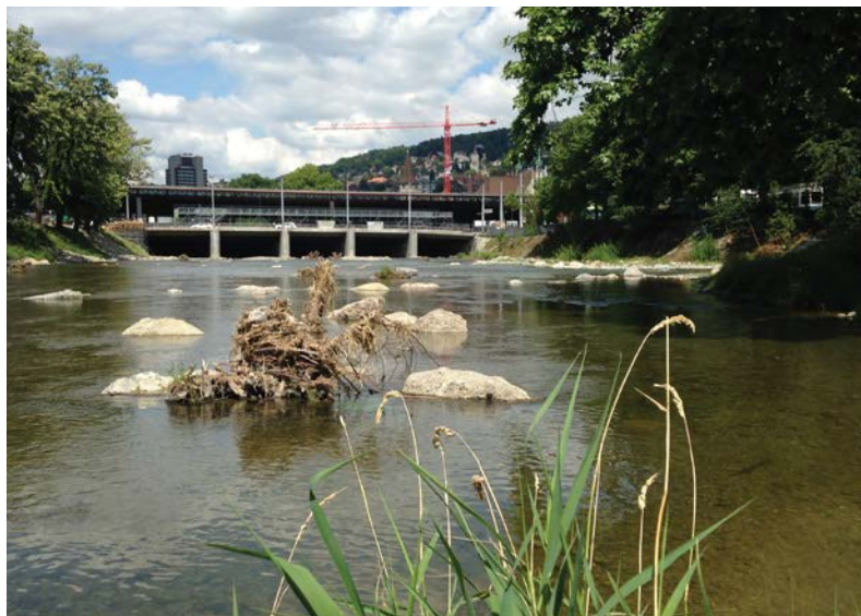
Im Zuge der Renaturierung wurde auch das Mäuerchen zwischen Schanzengraben und Sihl, das früher fast bis zur Postbrücke reichte, entfernt.

aaj. – Mit dem Abschluss der Bauarbeiten für die Durchmesserlinie in Zürich haben die SBB das Bauprovisorium vor der Postbrücke zurückgebaut. Gleichzeitig wurde die Sihl zwischen der Gessnerbrücke und der Mündung in die Limmat naturnah gestaltet. So wurde das Flussbett mit Findlingen, Kiesschüttungen, Astbündeln und Wurzelstöcken strukturiert, und am linken Ufer bei der Sihlpost wurden Fischunterstände eingerichtet. Von der Renaturierung profitieren in erster Linie die Fische.