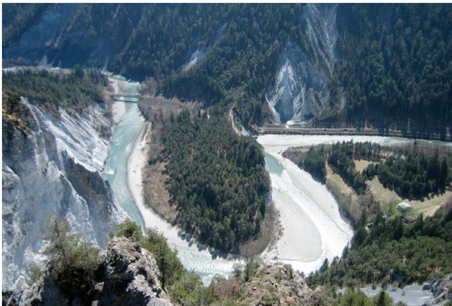
Die Vordererrheinschlucht ist ein Naturdenkmal von nationaler Bedeutung.

Eine Karte der Ruinaulta zeigt Schutzgebiete sowie Ein- und Ausbootstellen.