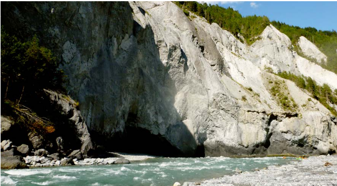
Das «Schwarze Loch» bei der Einmündung des Carrerabachs.