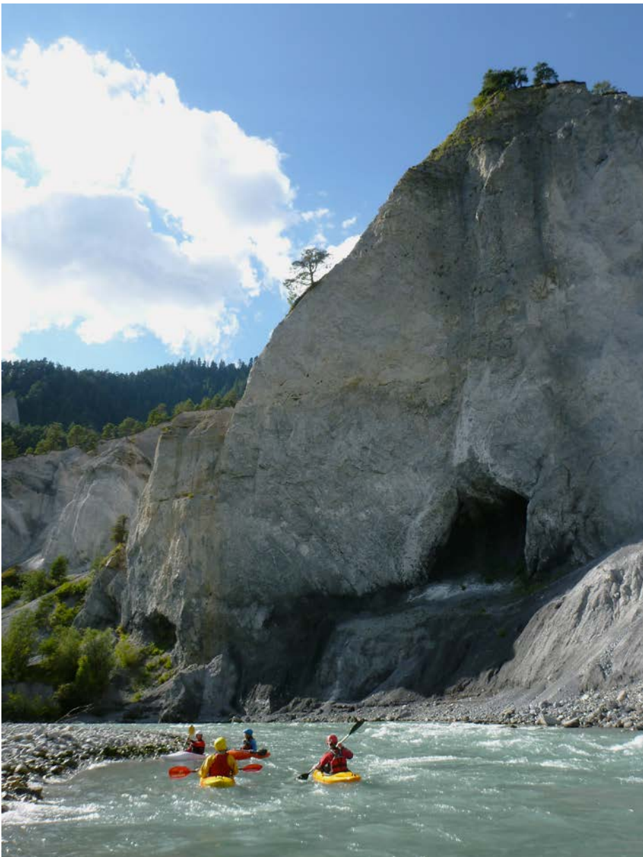
Paddler auf dem Vorderrhein, Höhe Versam-Station. (Datum der Aufnahmen: 22. Juli 2012)