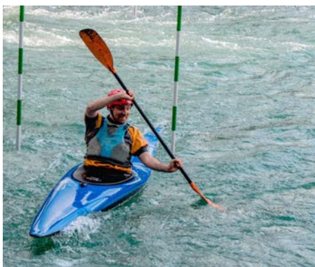
Ein Slalomtraining bringt viel für Wildwassertouren.

Ist Slalomfahren etwas für mich? Wer sich diese Frage auch schon gestellt hat, sollte unbedingt weiterlesen.