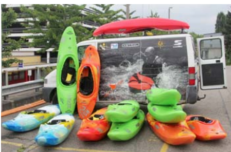
Boote für kleine und grosse Paddler – der WVZ verfügt über ein breit gefächertes Angebot unterschiedlicher Bootstypen.

Die kontinuierliche Erneuerung der Flotte der Vereinsboote ist dem Materialverwalter ein Anliegen. Dazu gehören auch Ausrüstungsgegenstände wie Paddeljacken.