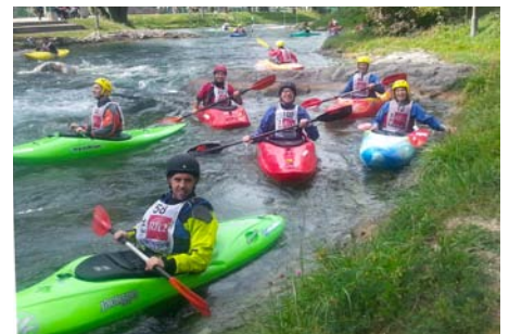
Glückliche Gesichter nach erfolgreicher Kanaleinfahrt.

ohne Probleme. Thomas meint: «Ist ja gar nicht schwierig.» Wir kommen in den Genuss einer Privatlektion von Michael, der uns geduldig jedes Kehrwasser zeigt und uns üben lässt. Wir paddeln so lange, bis man uns das Wasser abstellt, und sind am Ende höchst zufrieden. «Ich hatte mir eigentlich eine gemüt-