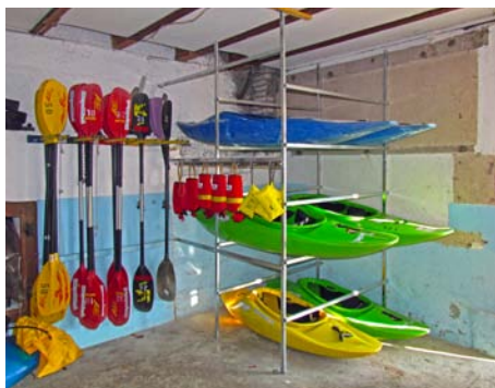
Im Bootshaus 2 wurde die Werkbank, die Wandkästen und weitere Einbauten zugunsten zusätzlicher Bootsplätze entfernt.

In den letzten Jahren konnten wir eine erfreuliche Zunahme beim Kanusport feststellen. Allerdings führt das dazu, dass es nur noch wenige freie Bootsplätze gibt. Der Neubau des Bootshauses 7/8 (nach dem Brand vom 29. Dezember 2010) hatte zwar