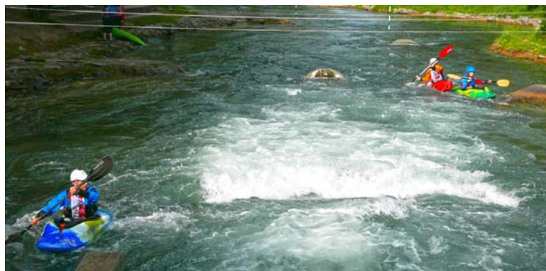
Das Abpaddeln fand 2015 auf dem Wildwasserkanal in Hünigen statt. Hier die von manchen gefürchtete Eingangswalze.

Nach der Mittagspause schliesslich fahren wir unter Michaels Anleitung alle den Kanal von oben, so wie es sich gehört. Christiane, Thomas und ich schaffen die Anfangswalze