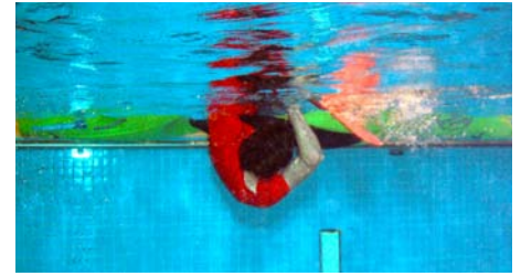
Ungewohnte Perspektive anlässlich eines Eskimotierkurses im Hallenbad. Ob die Rolle wohl klappt?

Nach dem verregneten Sommer 2014 freute ich mich schon sehr auf die Saison 2015, denn das Wetter konnte ja nur besser werden. Und der letzte Sommer war in der Tat fast perfekt. Leider konnten wir aufgrund einer reduzierten Anzahl Leiter im Erwachsenenbereich nicht ganz so viele Kurse anbieten wie im Vorjahr. Dementsprechend waren die Kurse gut besucht. An dieser Stelle möchte ich allen Leitern für ihren Einsatz danken!