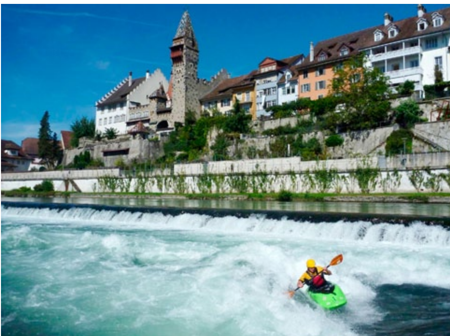
Im aargauischen Bremgarten lockt eine gute Welle Freestyle-Paddler an.

Durch mein Studium des Maschinenbaus an der ETH kam ich nach Zürich. Im WVZ sah ich eine gute Möglichkeit, meine Freude am Paddeln im Training an Jugendliche weiterzugeben. Seit mehr als zwei Jahren leite ich nun einmal pro Woche ein Jugendtraining im WVZ.