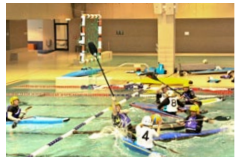
Voller Einsatz der WVZ-Mannschaft (mit gelben Helmen) am City Night Cup im Hallenbad Örlikon.