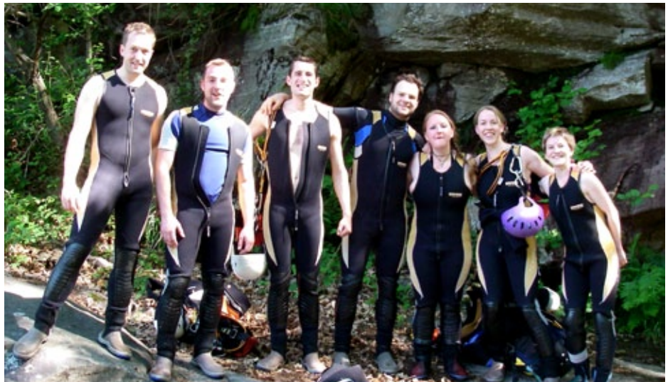
Das Canyoning-Team, bevor es losging.

Zu Beginn seilten sich die sieben neunzehn Meter in den Canyon ab. Der Weg führt erst in einem Rinnsal und dann durch einen Wasserfall in ein grosses Becken. Mitten in dieser