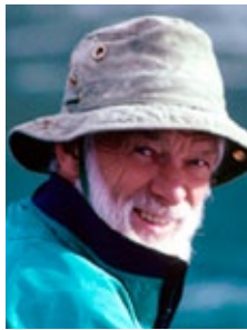
Bill Mason.

«The first thing you must learn about canoeing is that the canoe is not a lifeless, inanimate object – it feels very much alive, alive with the life of the river. Life is transmitted to the canoe by currents of air and the water upon which it rides. The behavior and temperament of the canoe is dependent upon the elements: from the slightest breeze to a racing storm, from the smallest ripple to a towering wave, or from a meandering stream to a thundering rapid. Anyone can handle a canoe in a quiet millpond, but in a