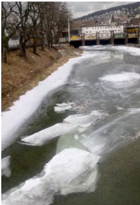
Der Frühling dieses Jahres war überdurchschnittlich warm. Sowohl der März als auch der Mai lieferten einen Wärmeüberschuss von mehreren Grad Celsius. Wer erinnert sich da noch an den kalten Februar mit Temperaturen in Zürich bis zu minus 14 Grad? Eis auf der Sihl war die Folge. Die Aufnahme wurde am 16. Februar 2012 von der Gessnerbrücke mit Blick Richtung Hauptbahnhof gemacht. (Text und Foto: aaj)