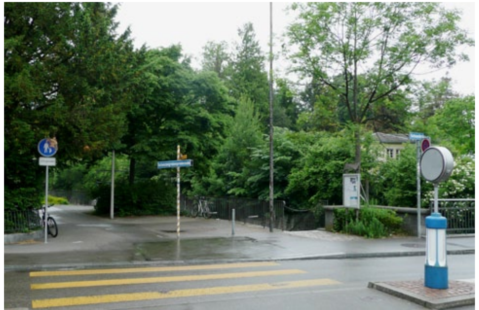
Situation beim Bootshaus Schanzengraben. Auf dem gepflasterten Bereich hinter der gelb-weißen Stange darf parkiert werden. Die Durchfahrt links davon muss frei bleiben.