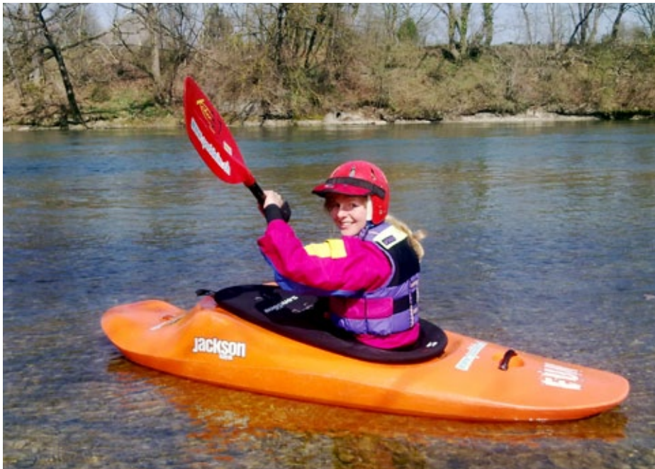
Die Autorin beim Einstieg in Bremgarten.

Beim Anpaddeln Anfang April kamen auch die Kinder eines «Welle»-Redaktors mit auf die Reuss. Der Schulaufsatz, den die Tochter (eine Sechstklässlerin) danach geschrieben hat, sei den Lesern der «Welle» nicht vorenthalten.