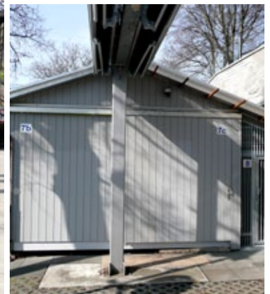
Die neue Nummerierung der Bootshäuser im Letten erleichtert die Orientierung.