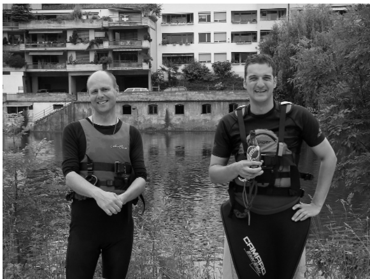
Eine kleine Pause, bevor es wieder an die Arbeit – Sicherung zu Wasser – geht

Wende dich an: alex@paddeln.ch oder per SMS an 078 860 50 50