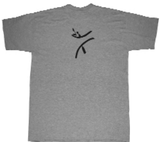
Vorderseite des WVZ-T-Shirts.