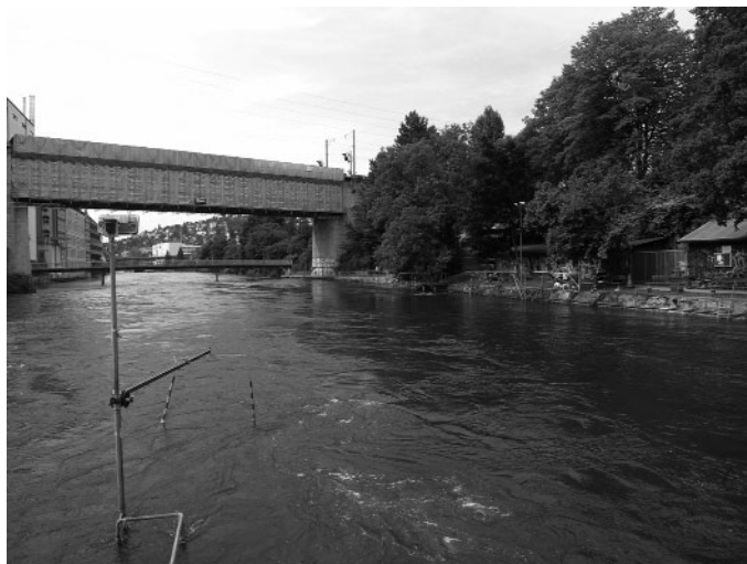
Nach den starken Regenfällen ist der Wasserspiegel der Limmat so hoch, dass die neuen Strömungshindernisse gänzlich überspült sind