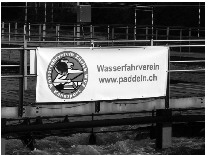
Das neue WVZ-Banner macht sich gut am Geländer der Badi