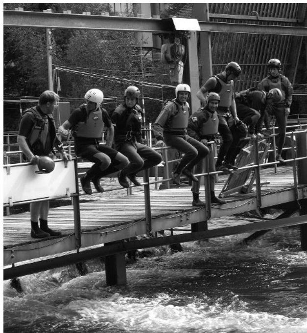
Sprung ins kühle Nass: Einige Unentwegte lassen sich vom Limmat-Hochwasser zum Höggerwehr treiben (3 Kilometer in 16 Minuten)