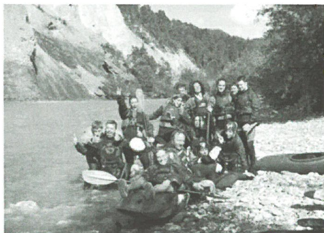
Eine Ausgelassene Gruppe genoss Pfingsten am Vorderrhein. Warst du auch dabei?

6. Eine komplette Ausrüstung kann vom WVZ gemietet werden. Zuständig ist der Materialwart, vgl. S. 8.