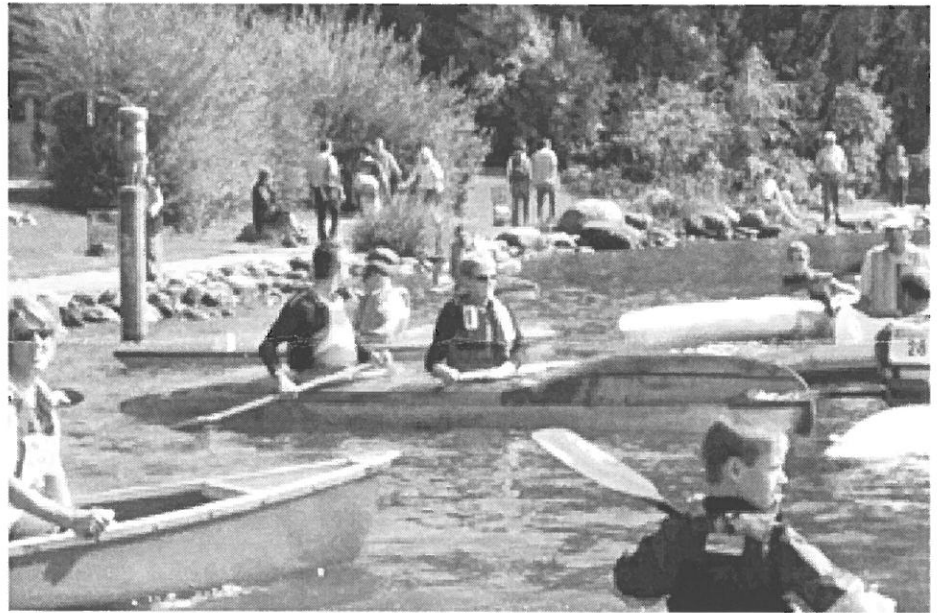
Die Teilnehmer warten auf den Startschuss.