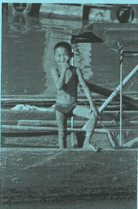
Bilder von Thailand und Laos gibt's am diesjährigen WVZ-Chlausabend zu sehen.