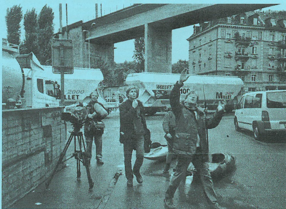
Teilnehmer des Jugendtrainings stehen für das Schweizer Fernsehen vor der Kamera. Das Ergebnis kann bei SF-DRS begutachtet werden.