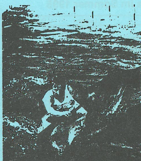
Slalom-Nationaltrainer Helmut Schröter im Endspurt.