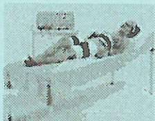
Jamutron Cellulite Behandlung

Gerne erwarten wir Sie für ein unverbindliches Gratistraining.